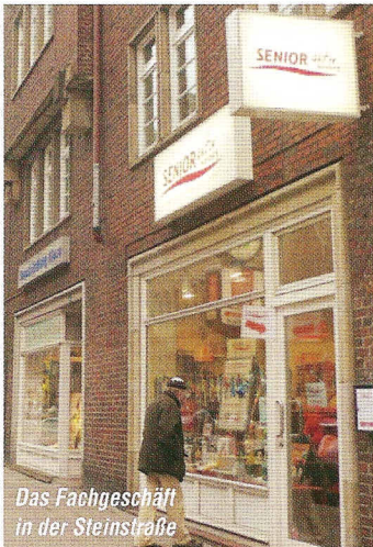
Das Fachgeschäft in der Steinstraße