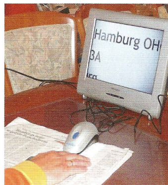
Die Monomaus: Zeitung lesen im Fernseher