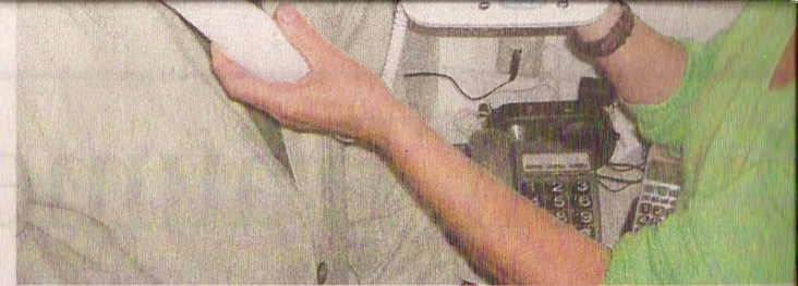
Übersichtlich: Großtastentelefone für Menschen mit schlechter S...

Ältere Menschen möchten elegante seriöse Produkte und Designlösungen, sagt Knigge. "Dafür gibt es in Zukunft einen großen Bedarf." Noch aber erkennen viele Hersteller den Trend nicht und reagieren erstaunlich verhalten: Das sei nicht ihre Zielgruppe, heißt es.