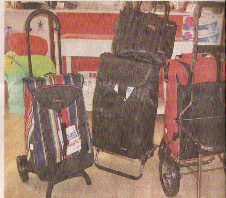
Der Shopper mit Klappsitz ist auch bei Straßenmusikanten beliebt.